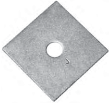
Arandelas planas cuadradas